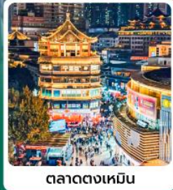
ตลาดตงเหมิน

• ไฮไลท์ OH Bay เป็นแลนด์มาร์คท่องเที่ยวและศูนย์การค้าทันสมัยริมทะเล กวนอูในเซินเจิ้น ขึ้นชื่อเรื่องการขอพร โชคลาภ บารมี ความสำเร็จในการทำงาน