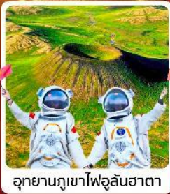
อุทยานภูเขาไฟอุลันฮาตา