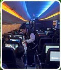
สายการบิน Condor Full Service