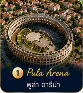
1 Pula Arena พู่ลา อาร์น่า