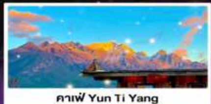
คาฟ Yun Ti Yang