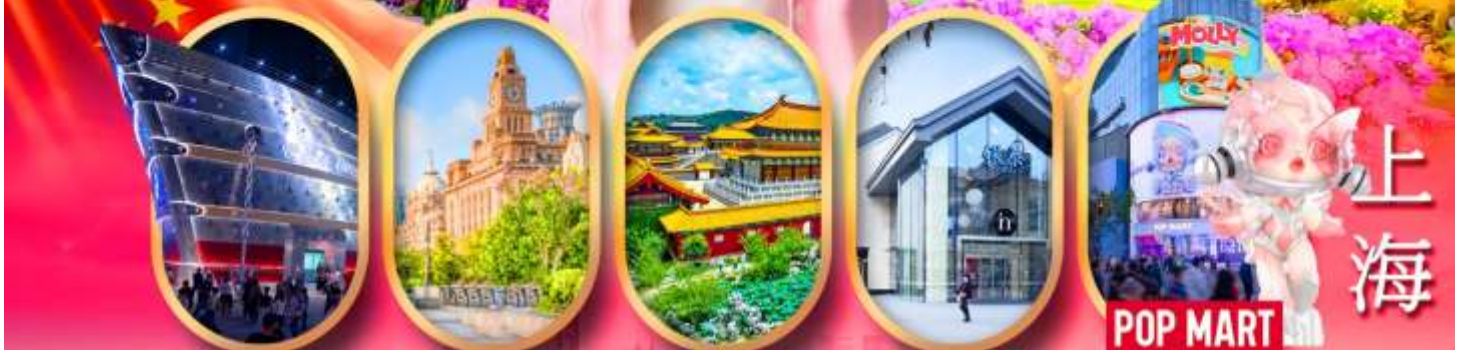
เรือคะหลุยส์