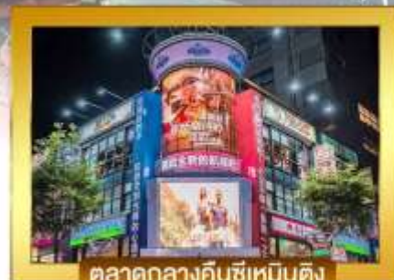
ตลาดกลางคินซีเหมินติง