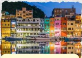
ทะเลสุริยขึ้นฉันทรา