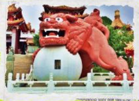
วัดเขวียนหวู