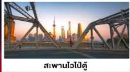
สะพานไวปี้ตู่