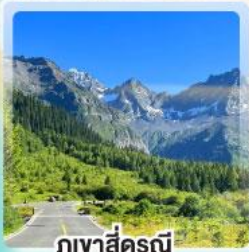
ภูเขาซีดรุณี