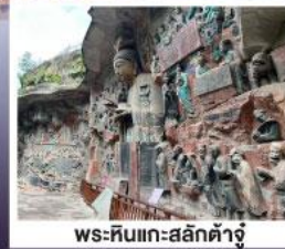
พระหินแกะสลักตำจู้