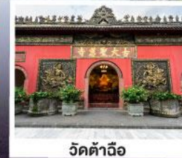
วัดตำจ้อ