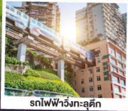
รถไฟฟ้าวังกะลุคัก