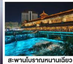
สะพานโบราณหนานเฉียว