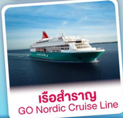
เรือสำราญ GO Nordic Cruise Line

เริ่มต้น 99,900.- แพ็คเกจสำราญ GO Nordic Cruise Line ห้องพักรวมวิวทะเลพร้อมสแกนดิเนเวียนบุฟเฟ่ต์