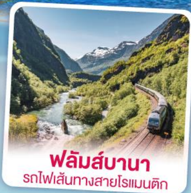
พลิ้มส์บานา รถไฟเส้นทางสายโรเมนติก